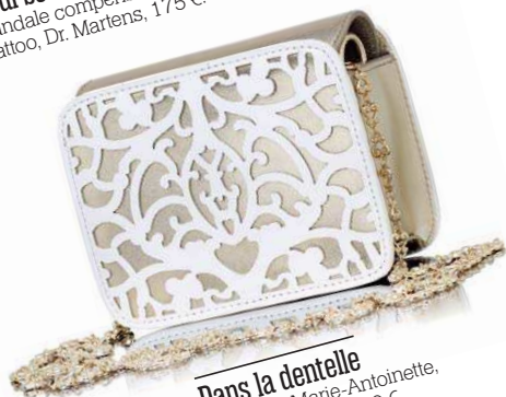
Dans la dentelle Sac-bijou Marie-Antoinette, Shao Shadow, 260 €.