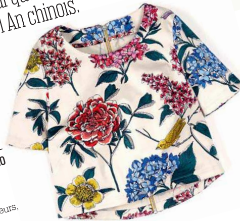
Jardin zen Cropped top en coton imprimé, Boden, 109 €.