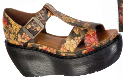
Course en socques Sandale compensée imprimée Tattoo, Dr. Martens, 175 €.