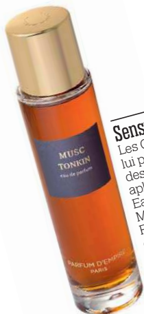
Sensuel Les Chinois lui prêtent des vertus aphrodisiaques. Eau de parfum Musc Tonkin, Parfum d'Empire, 120 €.

On oublie un temps les tentations nippones et les influences indiennes pour explorer un autre versant de l'Asie, qui inspire marques et créateurs à l'heure du Nouvel An chinois.