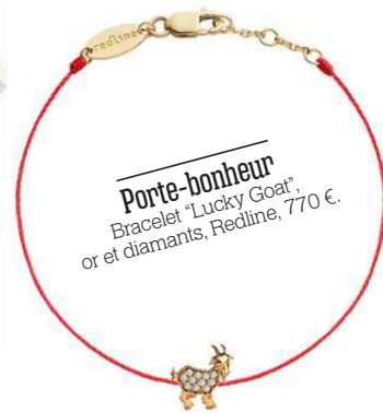
Porte-bonheur Bracelet "Lucky Goat", or et diamants, Redline, 770 €.