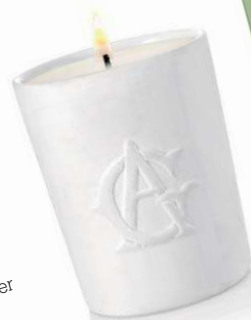
Prenez-en note Bougie déclinée de la nouvelle ligne L'île au thé, disponible dès le 1 er avril 2015, Annick Goutal, 55 €.