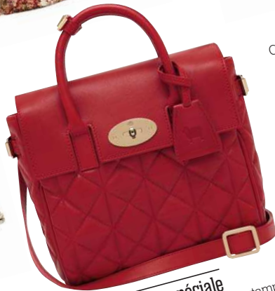
Édition très spéciale Sac Mini Cara Delevingne estampillé d'un bélier pour célébrer le Nouvel An chinois, Mulberry.