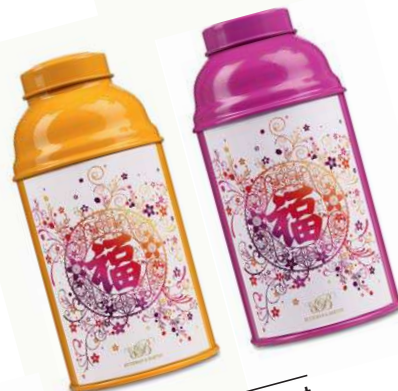
Dynamisant Trio de biberons 125 g, thés verts de Chine (Jasmin, Gunpowder, Lan xi), Betjeman & Barton, 62 €.