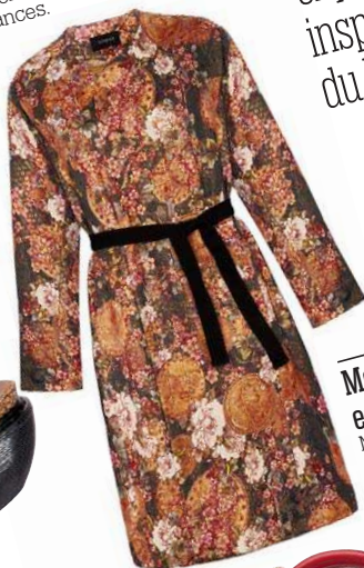
Mon kimono est beau Manteau ceinturé imprimé fleurs, Marks & Spencer, 123 €.